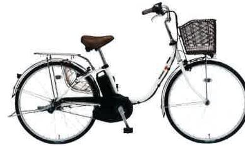
オフホワイト(F8F) ブラック&ブラウンパーツ仕様