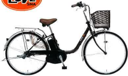
チョコブラウン(T2E) ブラック&ブラウンパーツ仕様

ブラック&ブラウンパーツ仕様 フレームカラーに合わせて、パーツカラーが異なります。(バスケット、サドル、グリップ等)