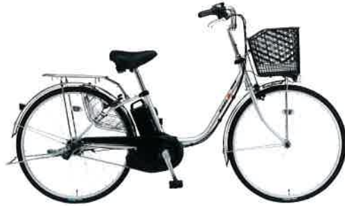
モダンシルバー(S4R) ブラックパーツ仕様